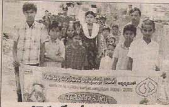
విద్యార్థులతో ర్యాలీ నిర్వహిస్తున్న దృశ్యం

పర్యావరణ పరిరక్షణలో భాగంగా ప్రతీ ఒక్కరూ నెట్టు నాటాలని ప్రకృతిని కాపాడాలని కోరారు. ప్లాస్టిక్ ను వినియోగించడం పూర్తిగా మానుకోవాలని, వ్యర్థపదార్థాలతో సేంద్రియ ఎరువు తయారు చేసుకోవాలని, రసాయనిక ఎరువులను వాడడం పూర్తిగా తగ్గించుకోవాలని రైతులను కోరారు. ఆనంతరం గ్రామంలో విద్యార్థులు ర్యాలీ నిర్వహించారు. ఈ కార్యక్రమంలో సంస్థ నిబ్బందితో పాటు విద్యార్థులు పాల్గొన్నారు.