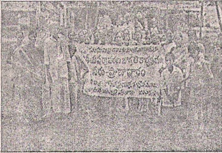
నీటి సంరక్షణపై ర్యాలీ నిర్వహిస్తున్న ధృత్యం

రాజకమతం, జూలై 4 : జాతీయ పర్యవ సీటిని పొదుపుగా వాడుకోవాలని రణ. జాగ్రతి కార్యక్రమంలో భాగంగా కోరుతూ సంఘమిత్ర డవలెప్ మెంట్ మండలంలో మేడిపాడ గ్రామంలో ఆసోసియేషన్ ర్యాలీ నిర్వహించారు.