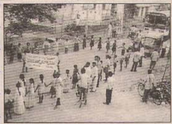
రోలుగుంటలో మానవహారం చేస్తున్న దృశ్యం

రోలుగుంట: ప్రపంచ ఎయిడ్స్ దినోత్సవాన్ని పురస్కరించు కోని సమీద స్వచ్ఛంద సంస్థ ఆధ్వర్యంలో రోలుగుంటలో ఐదవ ఐక్య రాష్ట్ర ర్యాలీ నిర్వహించారు. ఆనంతరం నర్సిపట్నం, టీరుని పట్నం రహదారిలో విద్యార్థులు మామనూరు చేపట్టారు. ఈ కార్యక్రమంలో సంస్థ ప్రతినిధులు పాల్గొన్నారు.