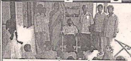
బాలకార్మిక విద్యావికాసకేంద్రాన్ని పరిశీలిస్తున్న ఎం.ఇ.ఓ.